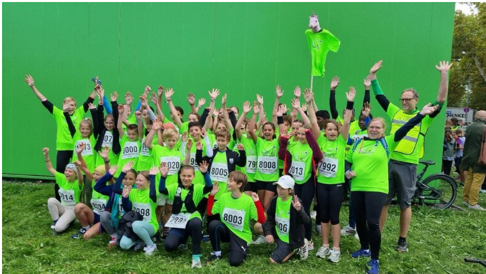
Abb.: Reformschule Kassel 42 Teilnehmer Minimarathon 2024

Die Mobilitätswoche wurde zudem vom Schulradeln begleitet, dass auch in der kommenden Woche noch fortgesetzt wird. Wir sind gespannt, wie viele Kilometer wir insgesamt sammeln können!